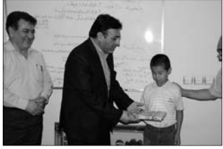
اهداء جوایز نقاشی با محوریت مختومقلی

سردار سرتیپ دوم پاسدار "حمید عطایی" همچنین با اشاره به تشدید فعالیت نظامی و ترافیکی در تفرجگاههای استان در سه ماهه تعطیلات تابستانی گفت: گلستان به دلیل داشتن مواهب طبیعی و اماکن تفریحی و گردشگری بسیار و قرار گرفتن در مسیر بارگاه ثامن الحجج امام رضا (ع) همه ساله خصوصا در ایام تعطیلات تابستانی میزبان خیل عظیمی از هموطنان از اقصی نقاط کشور است. وی روز پنجشنبه به ایرنا اظهار داشت: به منظور ایجاد محیطی امن و تامین آرامش خاطر مسافران و شهروندان، پلیس طرحهای ویژه ترافیکی و انتظامی را در دستور کار قرار داده و با استقرار ایستگاههای پلیس امنیت مطلوبی را برای شهروندان ایجاد نموده است. فرمانده انتظامی گلستان اضافه کرد: در اجرای این طرح با افرادی که به هر نحوی بخواهند امنیت شهروندان را به خطر انداخته و باعث سلب آسایش و آرامش آنان شوند پلیس با قدرت برخورد قانونی خواهد کرد. به گفته وی برابر بررسی های بعمل آمده بیش از ۲۰ نقطه مهم و پررفت و آمد شناسایی شده و از روز گذشته با استقرار ایستگاه پلیس، فعالیت طرح تابستانه آغاز شد. سردار عطایی در پایان ضمن دعوت شهروندان به رعایت قوانین و دستورات از آنها خواست با پلیس همکاری کرده و هر گونه موارد مشکوک را در تماس با مرکز ۱۱۰ گزارش دهند.