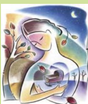
تاییارلان: غفور خوجه